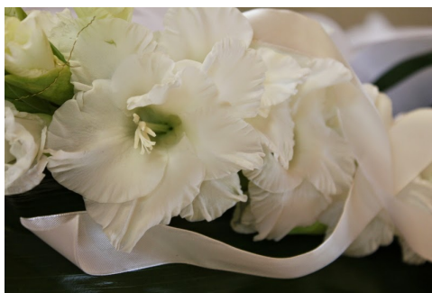
Rysunek 5: Kwiatek.

Nam dui ligula, fringilla a, euismod sodales, sollicitudin vel, wisi. Morbi auctor lorem non justo. Nam lacus libero, pretium at, lobortis vitae, ultricies et, tellus. Donec aliquet, tortor sed accumsan bibendum, erat ligula aliquet magna, vitae ornare odio metus a mi. Morbi ac orci et nisl hendrerit mollis. Suspendisse ut massa. Cras nec ante. Pellentesque a nulla. Cum sociis natoque penatibus et magnis dis parturient montes, nascetur ridiculus mus. Ali-